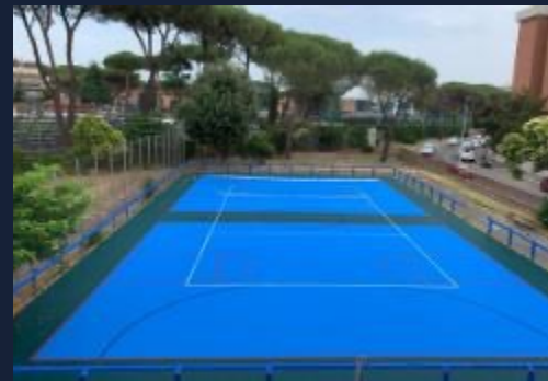
Intervento outdoor medie dimensioni