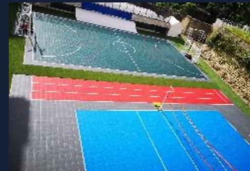
Intervento outdoor grandi dimensioni